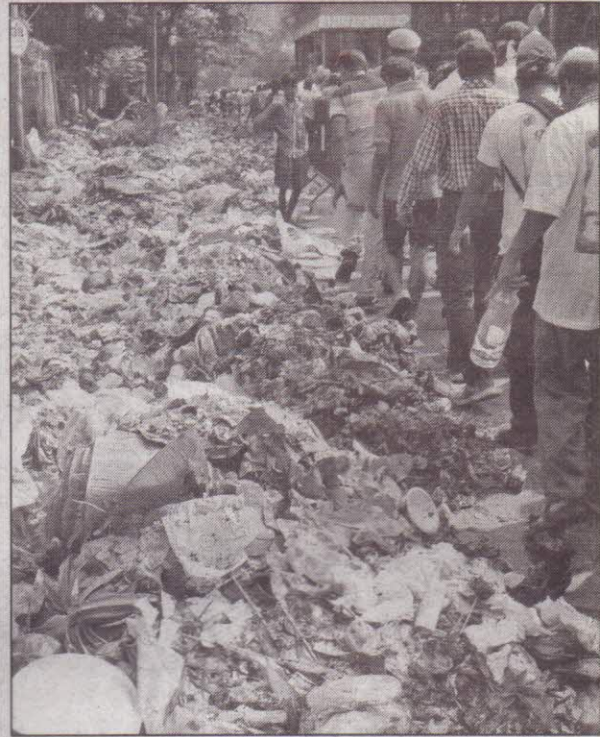
রোজকার চেনা ছবি। ব্রাবোর্ন রোডের ধারে জমে রয়েছে ময়লার স্তুপ। তার পাশ দিয়েই নাক বন্ধ করে যাতায়াত করতে হয় মানুষকে।

মন্দিরের প্রবেশের সবকটি পথে বসানো হয়েছে মেটাল ডিটেক্টর ডোর। শৃঙ্খলা মেনে পুণ্যাথীদের মন্দিরে প্রবেশ করতে দেওয়া হচ্ছে। হাওড়া স্টেশন থেকে শ্রাবণের এই মেলা উপলক্ষে বিশেষ ট্রেনের ব্যবস্থা করা হয়েছে। তারকেশ্বরের স্টেশন দিয়ে পুণ্যাথীরা যখন ফিরবেন সেইসময় ভিড় সামাল দিতে ট্রেনে ওঠা ও নামার সময় রেল পুলিশের নজরদারির বিশেষ ব্যবস্থা করা হয়েছে। সব মিলিয়ে শ্রাবণ মাসের ভিড় সামাল দেওয়াটাই এখন প্রশাসনের কাছে এক বড় চ্যালেঞ্জ।